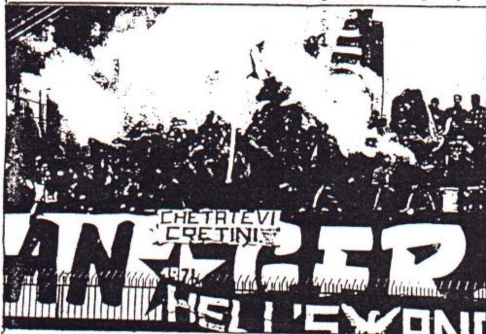
EMPOLI - CAGLIARI 1-0 (La Nord empoiese)

I precedenti risalgono tutti agli anni di B (83-86). Ricordiamo nell'anno 82/83 nel giorno della nostra promozione in serie B (Empoli-Paganese 4-1) un ignoto tifoso del Cagliari attaccò un grande striscione con scritto "Empoli...Cagliari ti aspetta in B". A Empoli sono venuti sempre in un numero alto anche se la maggior parte di loro proveniva dalle zone limitrofe. Sardi trapiantati. Si sono sempre fatti notare per un tifo caldo .....e dialettale. Nel 83/84 a fine partita fu loro rubato uno striscione. In effetti non ci sono mai stati grossi problemi con gli ultras rossoblu e crediamo che anche oggi filerà tutto liscio.....basterà non chiamarli sardegnaoli .